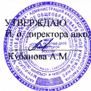
График посещения столовой учащимися МБОУ «СОШ а. Псаучье-Дахе имени Героя России О.М. Карданова» на 2023-2024 учебный год